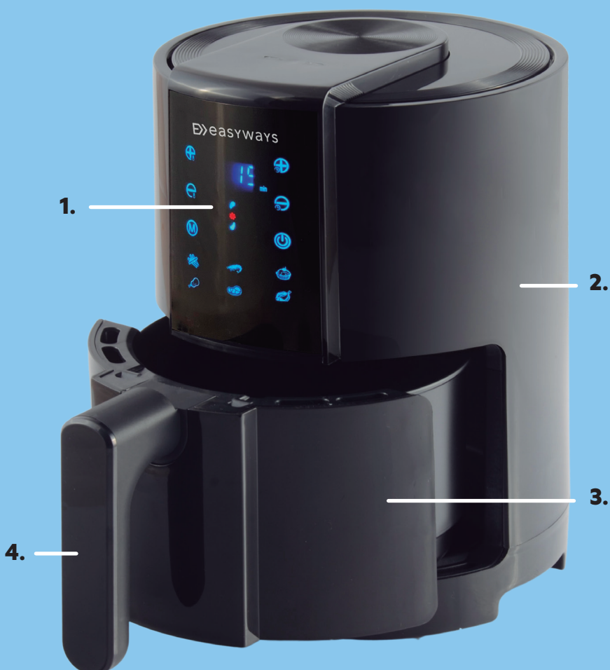
1. PANEL DE CONTROL TOUCH 2. BASE PRINCIPAL 3. CAJÓN 4. MANGO